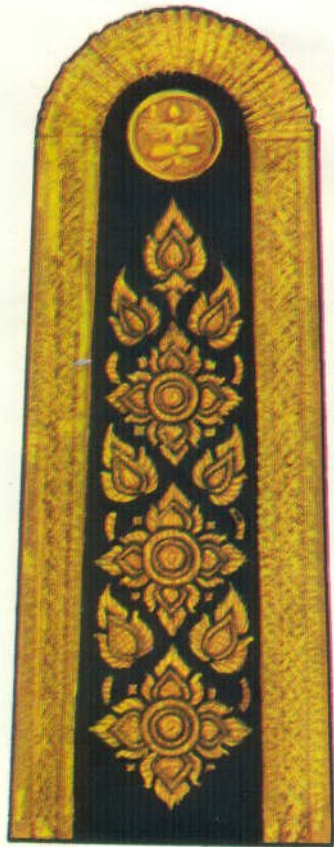
แบบอินทรรณูแข็ง